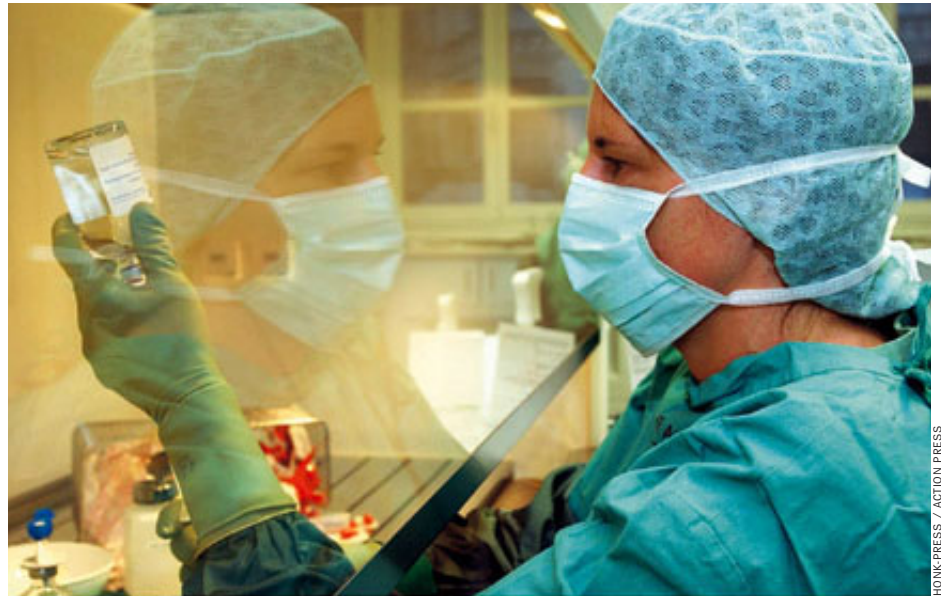
Forschung mit Zytostatika: „Es gab und gibt keine Erfolge“

Jedes Quartal verschreibt Overkamp seinen 1100 Krebspatienten Medikamente im Wert von etwa 1,5 Millionen Euro. Bundesweit summierte sich der Umsatz der Zytostatika zwischen August 2003 und Juli